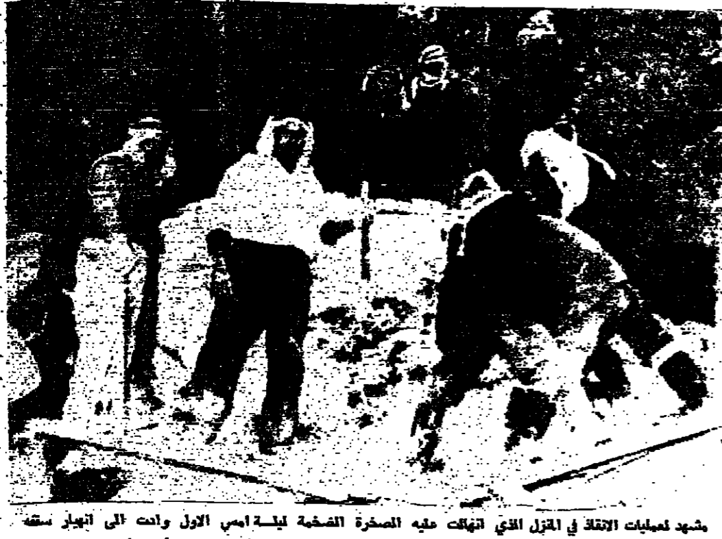
مشهد لعمليات التفتيش في المنزل الذي انتهت عليه الصخرة الفضية ليلة امس الاول وابتدأ الى انجاز سقفه

استمرار اصلاح خطوط الهاتف المطلة عمان - قام السيد عاكف الفايز وزير المواصلات بجولة تفتيشية لبعض انحاء العاصمة لاجتماع خلالها بالمهندسين العمال الذين يقومون باصلاح خطوط الهاتف التي تعطلت بسبب العواصف الثلجية التي اجتاحتها المملكة في الاسابيع الماضي . وصرح السيد الفايز بان الوزارة جتت كافة ااحتياطاتها لاعادة اصلاح هذه الخطوط بالسرعة الممكنة وان العمل مستمر يوميا ليلا ونهارا .